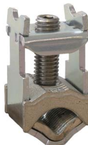
KM2G zacisk ramkowy typu V do 300mm 2