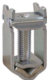
KM2G-F zacisk ramkowy typu V do 240mm 2