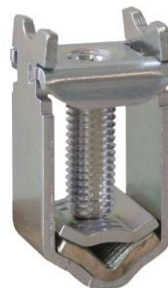
KM2G-F zacisk ramkowy typu V do 240mm 2