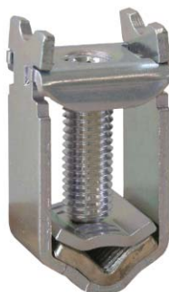
KM2G-F zacisk ramkowy typu V do 240mm 2