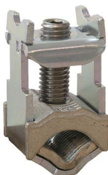
KM2G zacisk ramkowy typu V do 300mm 2