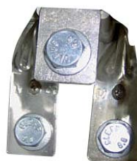
3A przyłącze płaskie